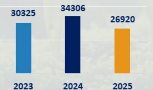
CONSUMO ELECT NAVE (KWh/año)