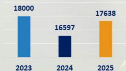
CONSUMO ELECT OFI (KWh/año)