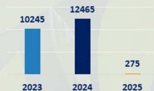
RESIDUOS NO PELIGROSOS OFI + NAVE (KG)