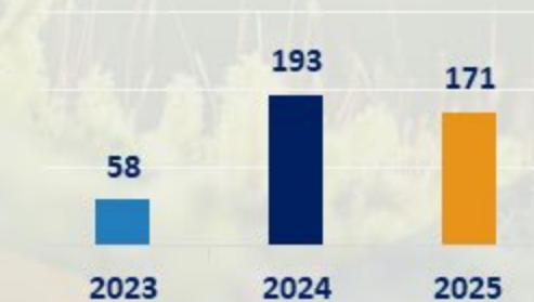
CONSUMO DE AGUA NAVE (M3)