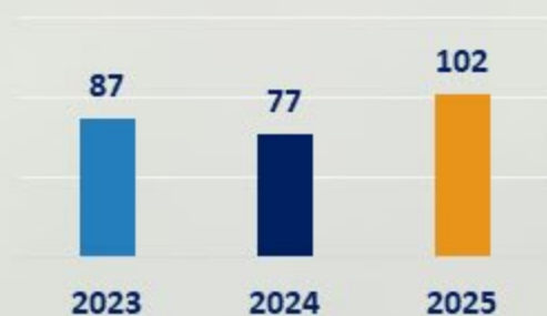
CONSUMO DE AGUA OFI (M3)